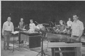
Les élèves de l'école de percussion d'Hyères en plein concert dans la salle des fêtes.

(1) Pour joindre Christophe Perez : 06.60.93.28.28.